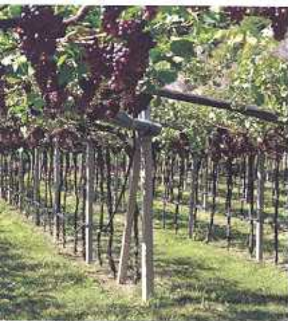
Obstbau / Viticoltura