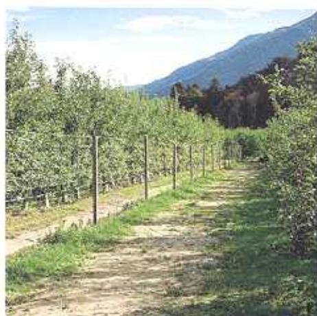
Umzäunungen / Recinzioni

Egal ob für Obstbau, Weinbau oder Umzäunungen jeglicher Art, wir haben für Sie immer die passende Lösung!